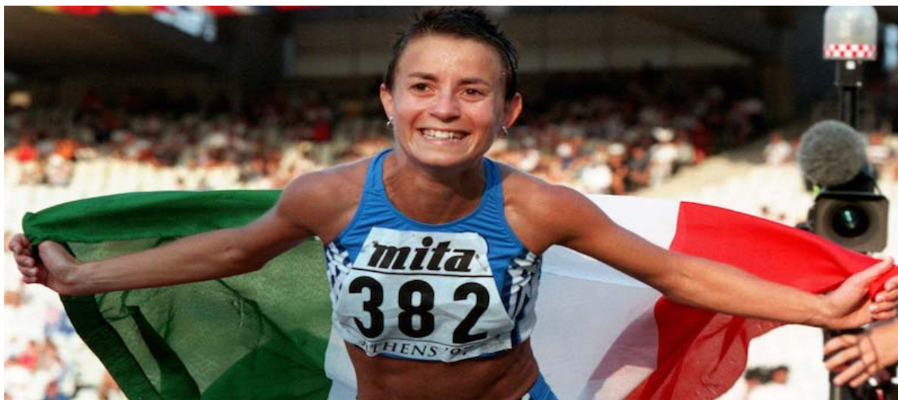
L'omaggio del ciclocross Messinese alla pluricampionessa di Marcia