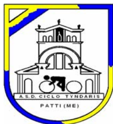
ASD Ciclo Tyndaris Patti